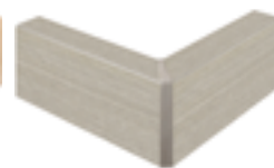
nobilitato rovere sabbia