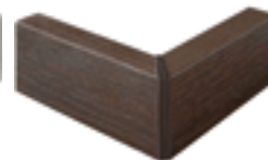
nobilitato rovere terra