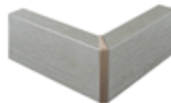
nobilitato rovere grigio